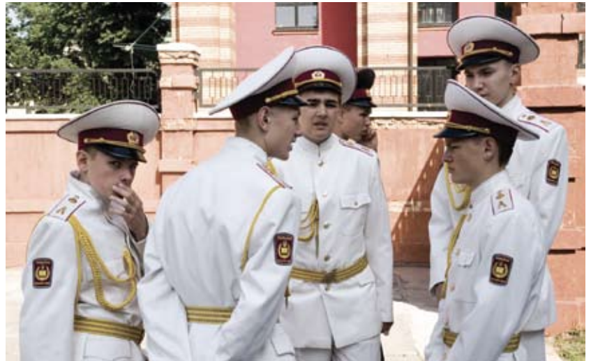
Вихованці Київського військового ліцею ім. Івана Богуна

Наше спільне переконання – лише особистість може виховати особистість. Тому необхідно створити для цього умови. Ми плануємо створити на базі військового інституту університету Шевченка курси для підготовки таких кадрів, і, думаю, обе-