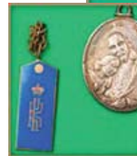
Жетон Одесского КК