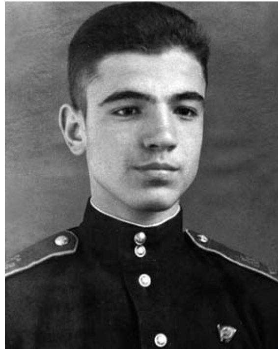
Геннадий Шпаликов, поэт, сценарист, режиссёр, выпускник Киевского СВУ 1955 года.

Наследственность – это только 8-10% нашего здоровья и наших шансов на долголетие. До 60% – это условия и образ нашей жизни, общая культура и физическая в том числе. Человек должен быть развит всесторонне. Что и старались делать в суворовском училище при помощи естественных наук, литературы, музыки и спорта. Важно все время тренировать свой мозг и свое тело. ■■■