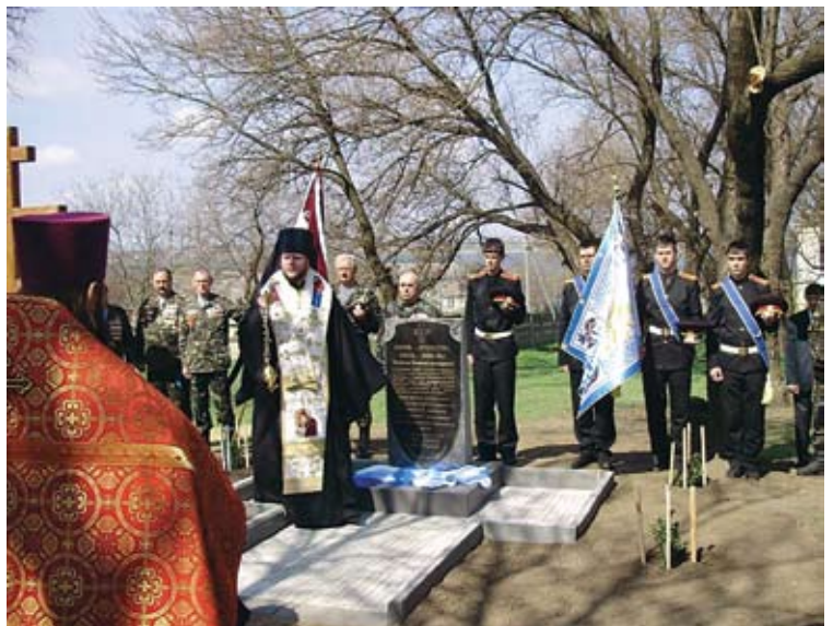
У памятника кадетам и офицерам, погибшим в бою у Канделя в феврале 1920 года.

Одесский Великого князя Константина Константиновича сухопутный кадетский корпус – 24-й по счету. Основан 16 апреля 1899 года по повелению императора Николая II (приказ по Военному ведомству № 116 за 1899 г.). 6 октября 1902 г. был освящен корпусный храм в память Святых равноапостольных братьев Кирилла и Мефодия. На торжестве освящения присутствовал Великий князь Константин Константинович. 7 октября 1905 года корпусу было пожаловано Знамя. В апреле 1906 года стало известно, что ко дню корпусного праздника в Одессу будет доставлено Помощником Главного Начальника Военно-Учебных Заведений, генерал-лейтенантом Анчутиным, Высочайше пожалованное корпусу Знамя. Генерал Анчутин прибыл со Знаменем 10-го мая. В этот же день, в 5 часов 30 минут, в портретном зале состоялась торжественная прибавка Знамени. 11-го мая, в день корпусного праздника, после литургии, на плацу состоялось освящение Знамени. По окончании освящения генерал Анчутин прочел Высочайшую Грамоту и передал освященное Знамя директору Корпуса, который вручил Корпусную Святыню первому Знаменщику В. У. О. Козловскому 1-му. Подлинное корпусное Знамя до наших дней не сохранилось, поскольку было утрачено в годы Гражданской войны.