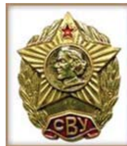
Знак об окончании СВУ

Дорогие друзья! У кого есть артефакты, исторические документы, которые касаются истории кадетских корпусов, СВУ просьба сообщить редколлегии журнала