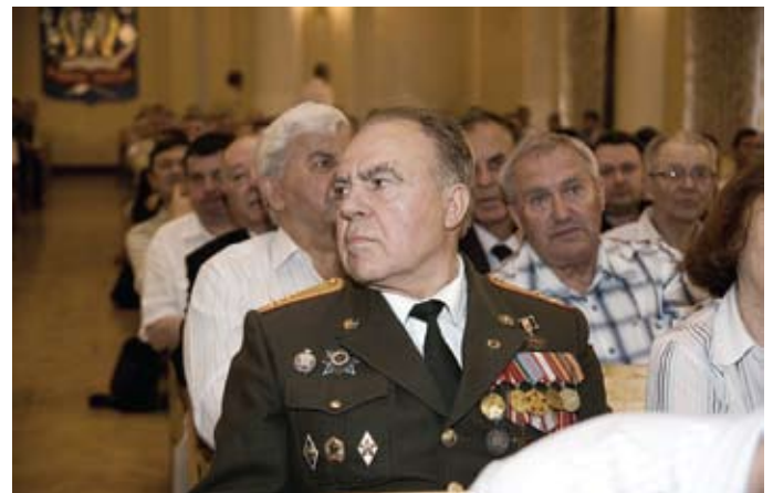
В актовом зале училища собрались представители разных поколений суворовцев.