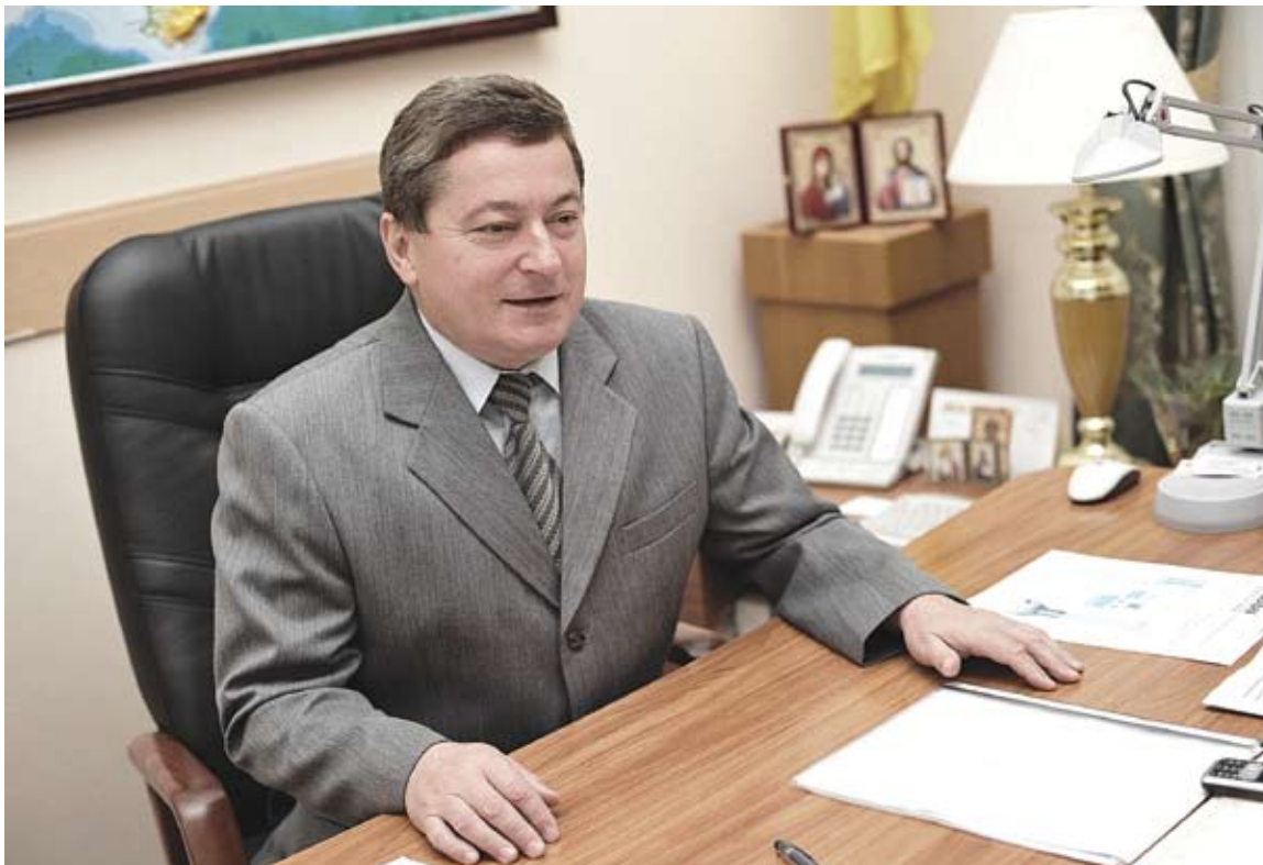
Микола Іванович Науменко, директор Департаменту військової освіти та науки Міністерства оборони України, доктор технічних наук, професор, заслужений діяч науки і техніки України, лауреат Державної премії України у галузі науки і техніки.