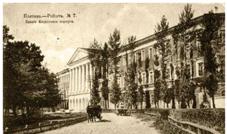
Петровский Полтавский кадетский корпус