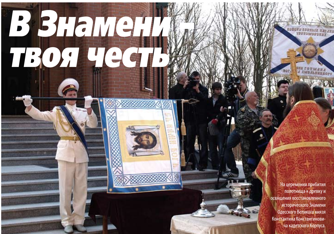
На церемонии прибития полотнища к древку и освящения восстановленного исторического Знамени Одесского Великого князя Константина Константиновича кадетского Корпуса.