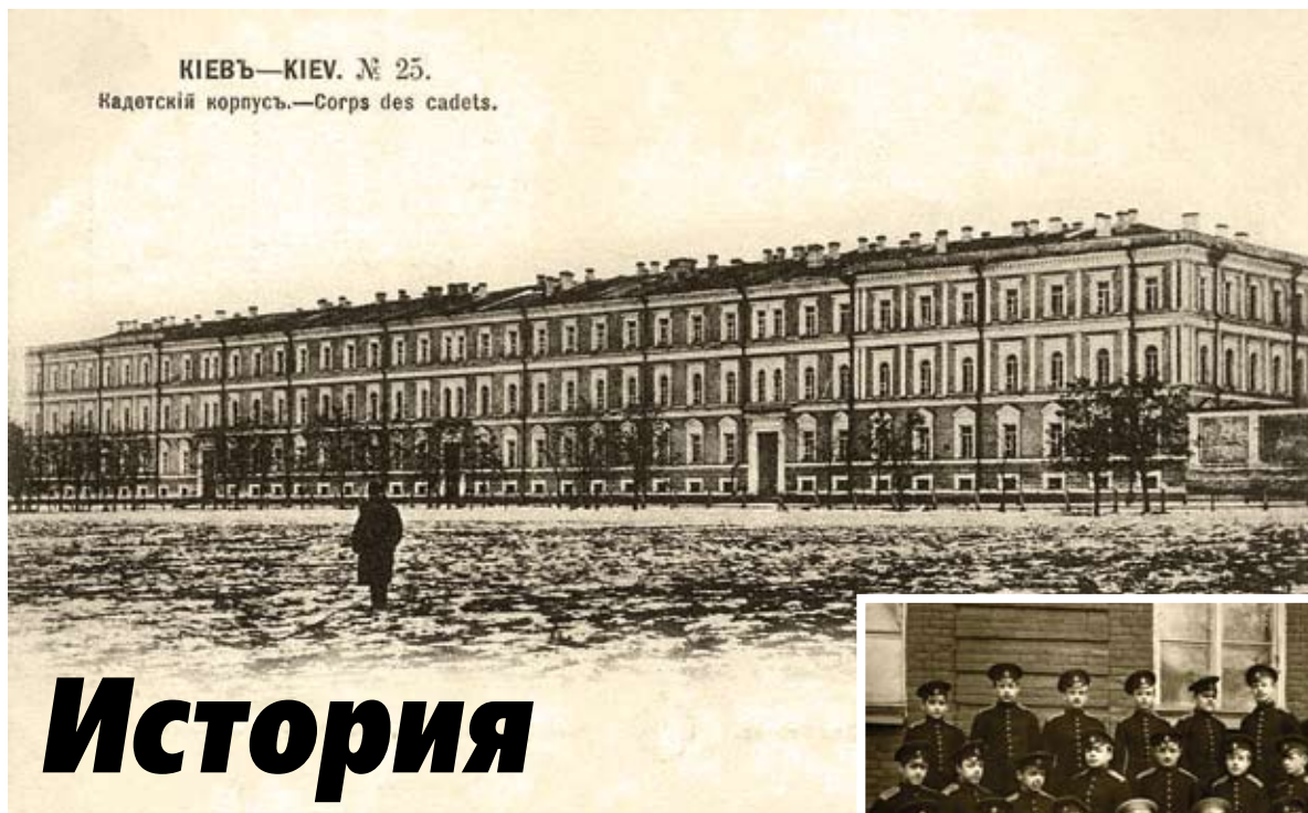
Владимирский Киевский кадетский корпус