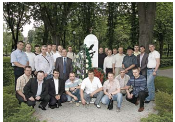
Делегация участников Сбора у памятника «Кадетам, суворовцам, военным лицеистам, погибшим на поле брани, умершим от ран и болезней, отдавшим душу свою за Веру и Отечество».

Отечество» на территории Храма Вознесения Господня в Соломенском районе г. Киева.