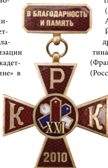
Памятный знак Съезда - «В благодарность и память».

шим от ран и болезней и отдавшим душу свою за Веру и Отечество», установленного в Киеве. ■ ■ ■