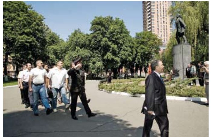
Выпускники 1951-2009 годов прошли торжественным маршем, отдавая воинскую честь А. Суворову

После мероприятий в училище делегация участников Сбора возложила цветы к памятнику «Кадетам, суворовцам, военным лицеистам, погибшим на поле брани, умершим от ран и болезней, отдавшим душу свою за Веру и